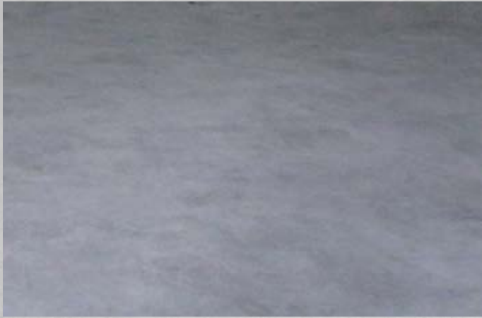
Betónová doska s vláknom Fibrofor Green 600g / m 3